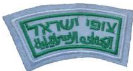
טלאי צופים עברית - ערבית