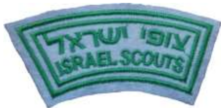
טלאי צופים עברית - אנגלית